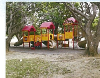
幼児用の遊具もあります!