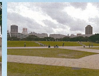
広場では、タコ揚げ等も楽しめます!