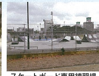
スケートボード専用練習場もあります!