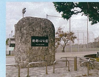
奥に見えるのは、人工芝のグラウンドです!

公園の雰囲気はとても良く、立地が街の中心地ということもあり、外周をジョギングやウォーキングなど自由に使い、サッカーやテニスなど色々楽しめ、第一・第三日曜はフリーマーケットも楽しめ賑わいのある公園です。